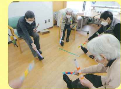
今日は棒体操!! 身体づくりと 転倒の予防をします