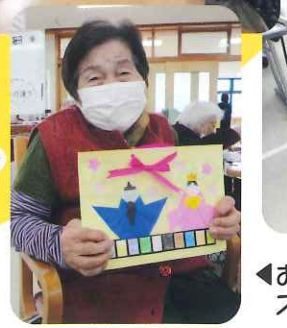
お持ち返りする個人作品、 ステキに仕上がっています