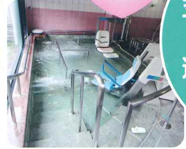
気泡・超音波機能があって リフレッシュ気分!