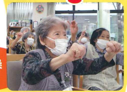
元気ハツラツ全員参加!