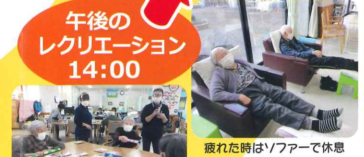
疲れた時はソファで休息