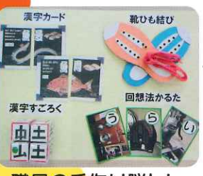
職員の手作り脳トレ