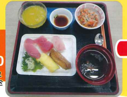
5つの形態に分けられ 個々に合ったお食事を 提供します