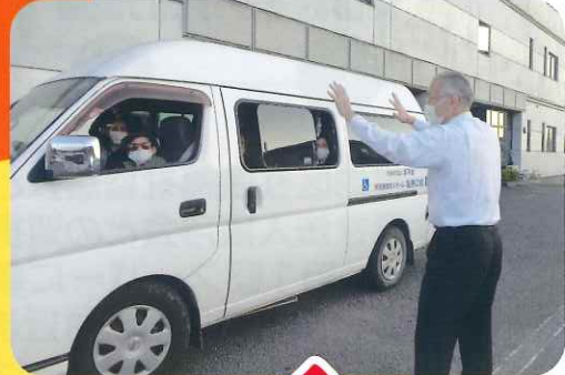
施設長がお見送りします!

もぐもぐ倶楽部 (緩和型) ~自立支援に向けた予防介護~ (介護度が要支援1・2の方と事業対象者の方が対象)