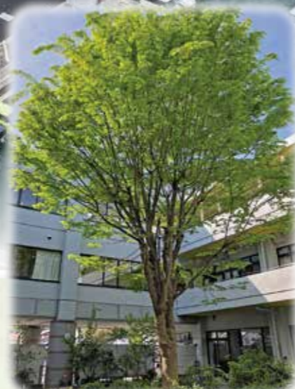
〔亀寿の郷 シンボルツリーのけやき〕 平成6年の開所時より共に歩んできました。