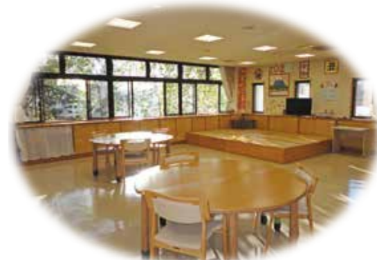
▲温かな日差しが入るサロンでは、 ゆったりとした時間が流れます。