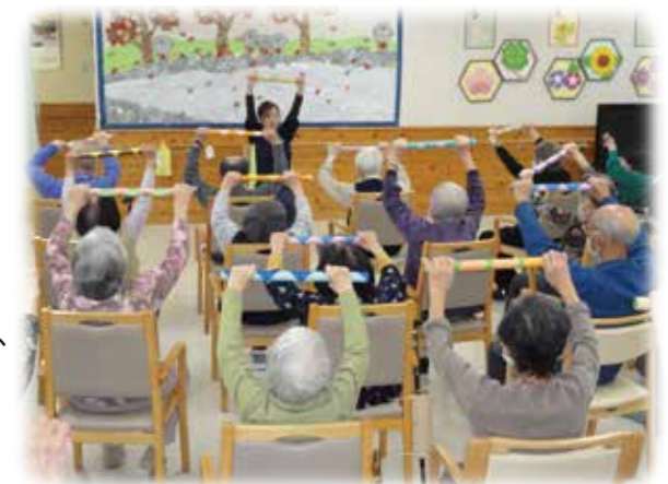
▲意欲や感動を引き出せる、さまざまな活動をご用意しています。