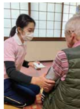
◀訪問時は馴染みのヘルパーが、まず体調確認を行います。体調の変化が観られた際は多職種と連携を図ります。

ケアプランに基づき、入浴・排泄などの「身体介護」、洗濯・掃除などの「生活支援」を行い、ご利用者様ができる限り在宅での生活が継続できるよう支援します。