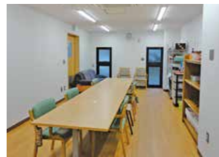
◀緩和型もぐもぐ倶楽部では、 自立支援に向けた活動の 参加や在宅生活に 活かせる知識、身体能力の 維持と向上を目指します。