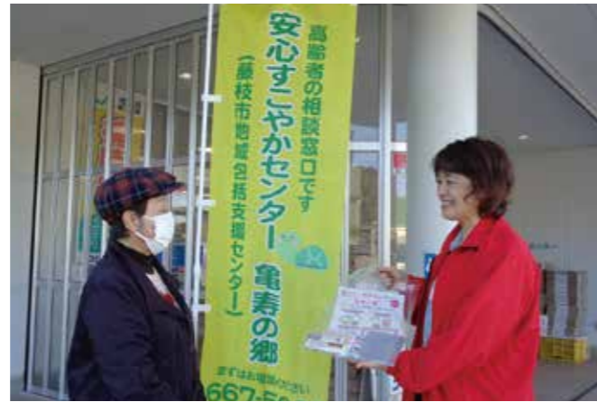
▲地域に出向き、健康づくり、介護予防のお手伝いをしたり、 地域内のさまざまな機関や団体と協力体制を築いていきます。