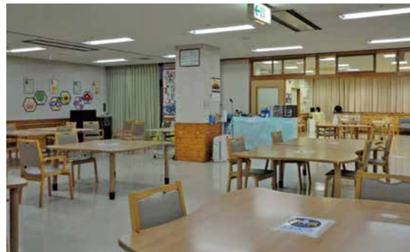
▲人と人との交流で日々活気があふれた時間が流れています。 ご利用者様の生きがいとなっています。

地域で暮らす高齢者ができる限り在宅での生活が継続できるよう、食事・入浴・排泄などの日常に必要な支援をします。集団体操、趣味活動などの提供を通じ、生活機能訓練を行い、また社会的交流の場を提供します。 ご家族様の精神的、身体的負担の軽減を図ることも目的の一つです。