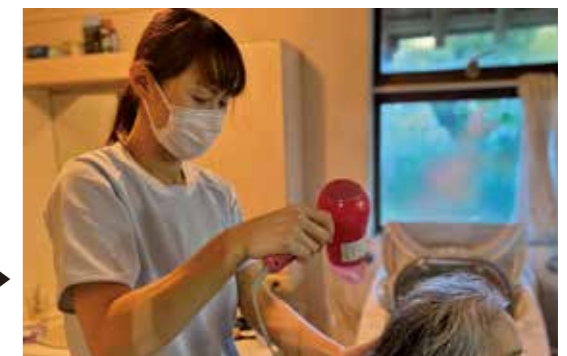
自宅のお風呂での入浴介助も行います。▶ ご本人様、ご家族様の生活に寄り添った ケアに努めます。