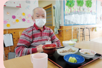
ご飯を召し上がる直前までマスクをしていただき、黙食をお願いしています