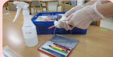
使用後の色鉛筆は消毒します