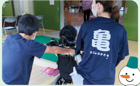
朝比奈小学校 *車椅子を押す体験