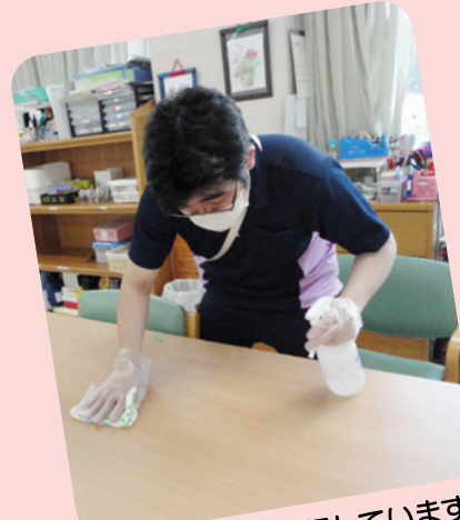
1時間おきに清掃しています