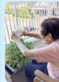
しそを育てました