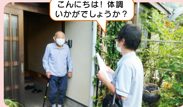
こんにちは! 体調いかがでしょうか?

月に1回、ケアマネジャーによるモニタリング訪問では必要な感染対策を行った上で短時間での訪問を心がけております