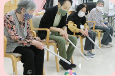
レクリエーションには使い捨てのできる新聞や洗濯可能なタオルを使用します

皆さまの変わらぬ笑顔のために、利用者様や職員の体調管理、また、施設内の消毒を徹底し、安心してご利用できる環境づくりを行っています