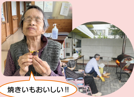
焼きいもおいしい!!

現在、多床室 50 名・ユニット型個室 40 名の、合計 90 名の入居者様が亀寿の郷で生活されています