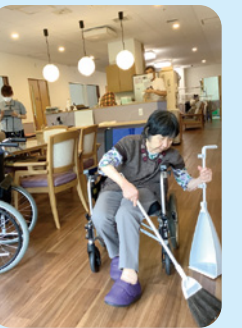
お部屋のお掃除も!