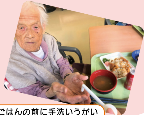
ごはんの前に手洗いうがいと手指消毒をお願いします