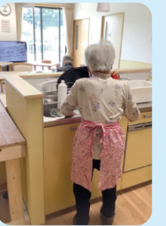
お茶碗をよく洗ってくださいます!