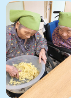
生姜で佃煮作りしました