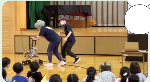
認知症のお年寄りを地域で支える寸劇を通じ、考える機会を設けました 岡部小学校