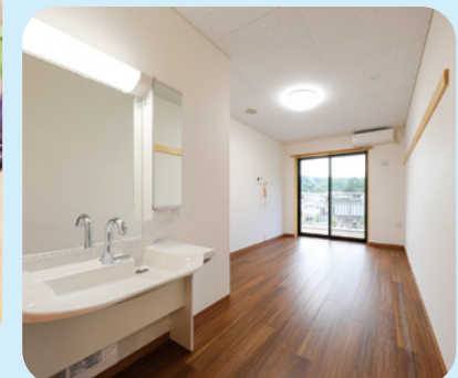
居室には、「自分らしく」暮らすための家具を自由にお持ちいただけます